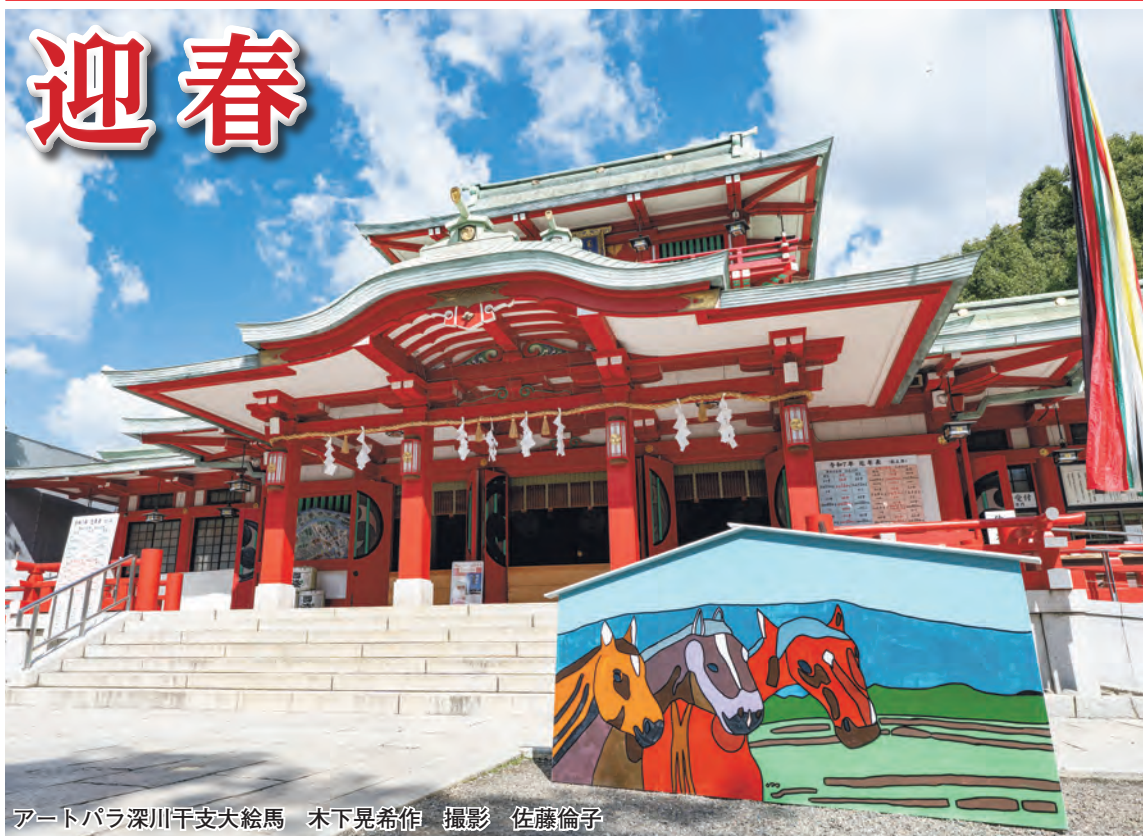
アートパラ深川千支大絵馬 木下晃希作