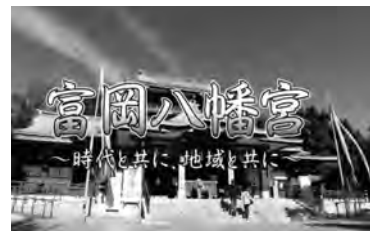
公式動画「時代と共に、地域と共に」

上記のSNSで八幡宮の最新情報を発信しています。 You Tube では公式案内動画「時代と共に、地域と共に」 「昭和43年本祭り」などを配信中。是非ご覧ください。