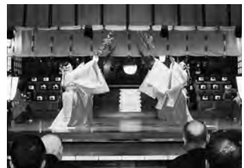
祭典諸行事のご案内をいたします