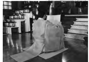
毎朝、皆様のご安泰を祈念いたします