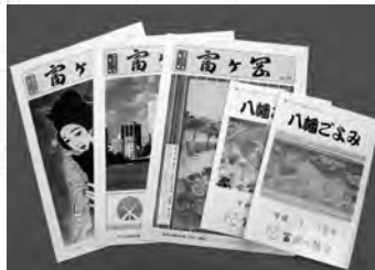
出版物を贈呈いたします

神は人の敬によりて威を増し 人は神の徳によりて運を添ふ 鎌倉時代に制定された日本初の武家法であり、武士だけでなく庶民にも強い影響を与えた御成敗式目。その第一条に記されたのが、右の言葉です。 神様は人間の尊び敬う心によってそのお力を増し、また人間は神様のお力をいただいて運を開く。 古代からの日本人の信仰心を端的に表したこの言葉。神様と人とは一方通行ではない、お互いがお互いを高めあう存在であるという思い。 その思いをかたちにしたのが、崇敬会です。 当富岡八幡宮崇敬会は、八幡様の御神徳をより一層仰ぎ、自身だけでなく世界中の人々とともに幸福でありたいという人々により、結成されました。 どうぞご入会いただき、八幡様とともに日々の生活をますます充実したものといいたしましょう。