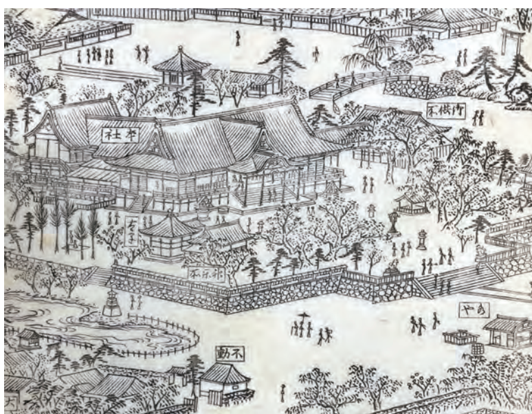
江戸時代の境内（江戸名所図会より）